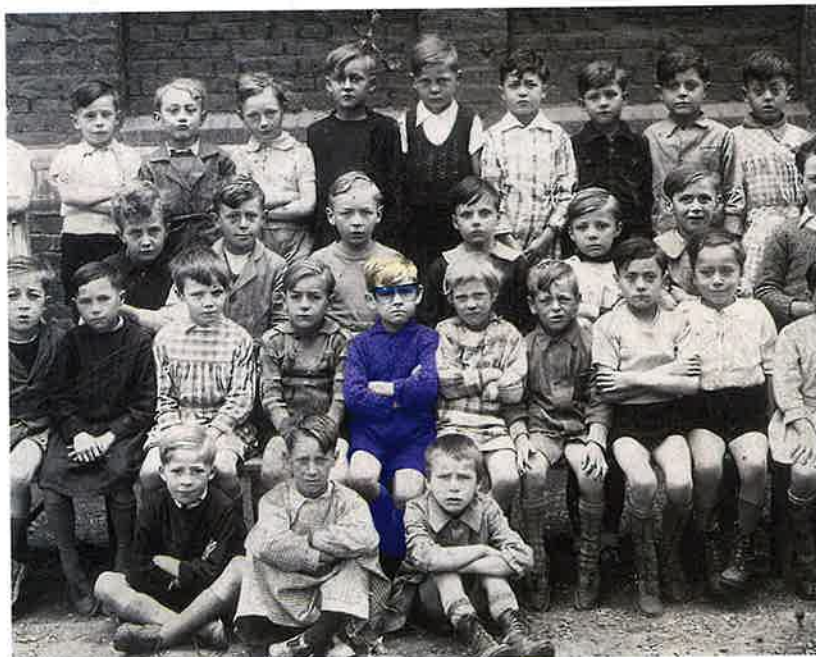
Le futur Prince Bleu de Montmartre à l'école d'Amiens.

main que le succès n'a pas changé. Il aime être aimé tout simplement comme nombre d'entre nous. Un homme qui suscite une immédiate sympathie et qui ne dissimule rien « J'aime être populaire, c'est le plus beau cadeau que la vie m'ait donné alors oui, je suis peut-être